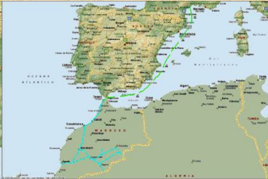
ingrandimento 249 Kb

Percorsi realizzati con Microsoft AutoRoute 2001