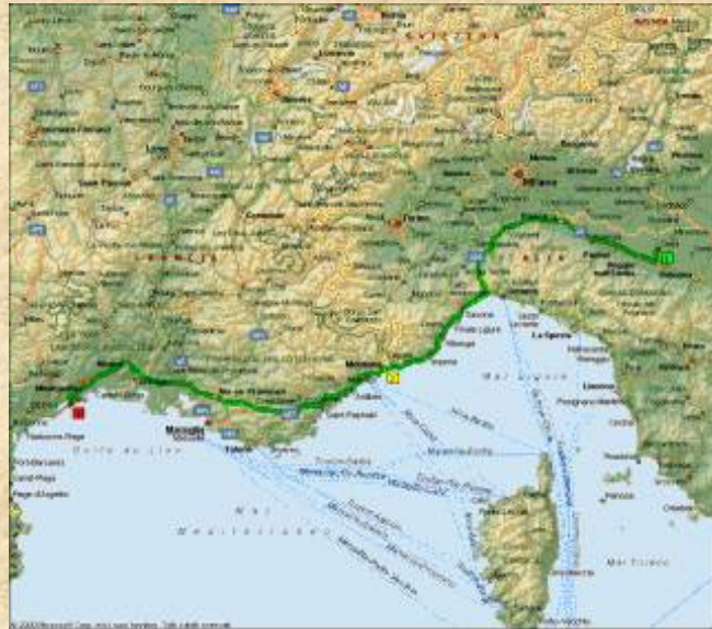
ingrandimento 154 Kb